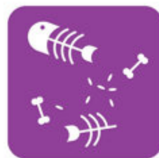
Restos de seres vivos marinhos