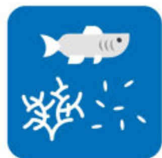
Seres vivos marinhos